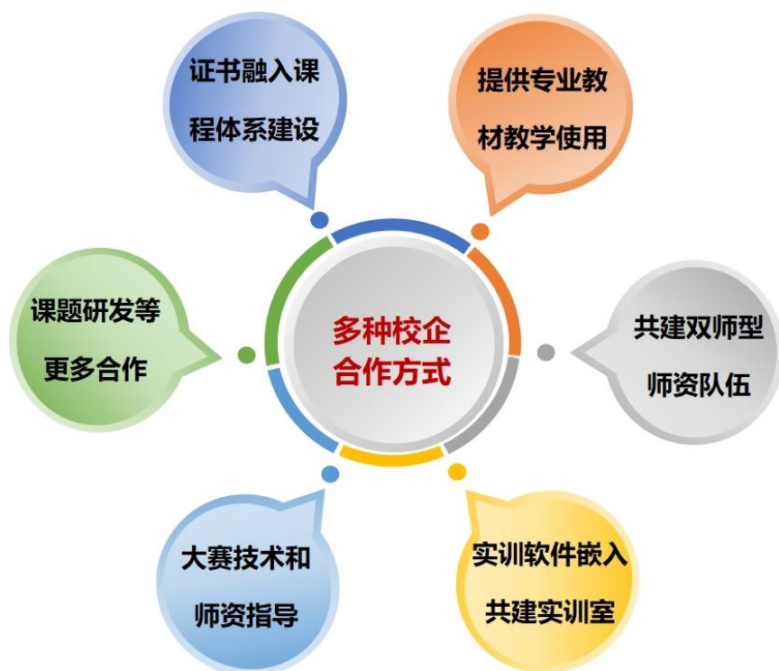
图 2：线上线下结合的校企合作模式