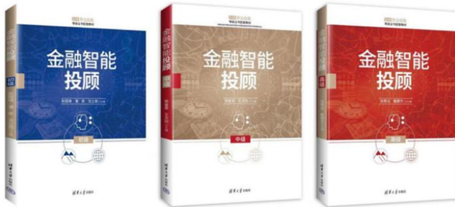
图 3：金融智能投顾职业技能等级标准教材